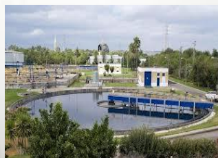
Depuración de agua