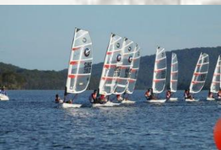
Actividades acuáticas, pantano de Cubillas