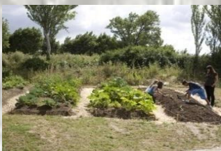
Actividades agrícolas en huerta ecológica