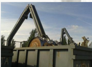
Reciclaje en Granada